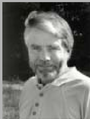
Per Gahrton, ledamot av EU-parlamentet.

L tjugofem år, sedan Sadats berömda Jerusalembesök 1977, har den arabiska stormakten Egypten, subventionerad av USA-dollar, bortsett från en del vackra ord, stått vid sidan av Palestinakonflikten.