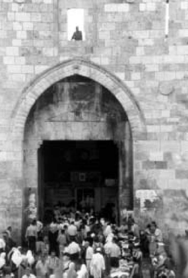
Damaskusporten Jerusalem – palestinier under ständigt militär övervakning.