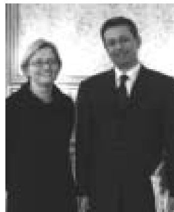
Mustafa Barghouthi träffade Anna Lindh i januari.

Sveriges Mellanösternpolitik under Göran Persson ligger inte fast. Istället har den förändrats i riktning mot en pro-israelisk hållning. Vi vet att kritiken inom (s) är stark mot detta framförallt från Broderskapsrörelsen, SSU och kvinnoorganisationer.