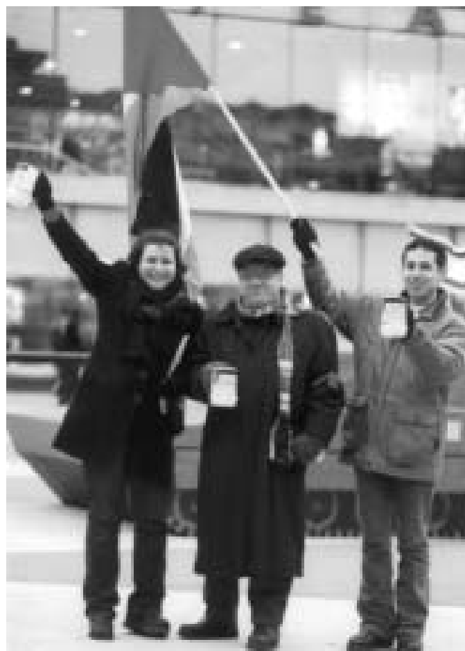
Insamling på Sergels torg i samband med manifestationen "En stridsvagn på Sergels torg".

En ny ansökan lämnades in till Forum Syd och ett positivt