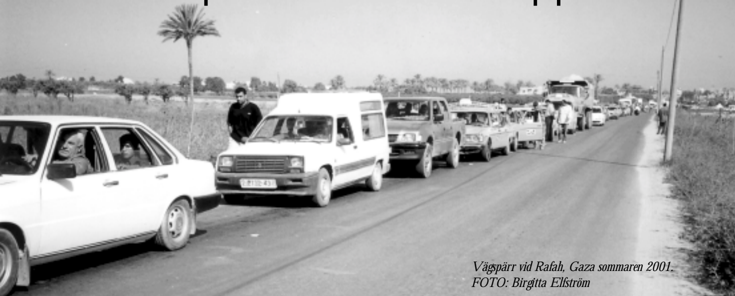
Vägspärr vid Rafah, Gaza sommaren 2001.

"Ana bahki schway arabi!" "Va? Pratar du arabiska?" "Schway, schway, schway arabi." Så började ofta konversationerna ute på det ockuperade Västbanken. Först satt vi bara och tittade på varandra och log. I många byar var de inte vana vid att få besök, särskilt nu när de flesta byar är helt isolerade och det inte går att ta sig dit med bil. Efter att jag sagt några få ord på mycket dålig arabiska, vågade också de som kunde prata engelska använda den.